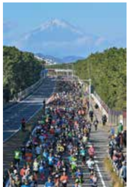
▲アクアクララのボトルがランナーの給水をサポート!